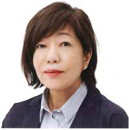
林 真理子 Mariko Hayashi 作家