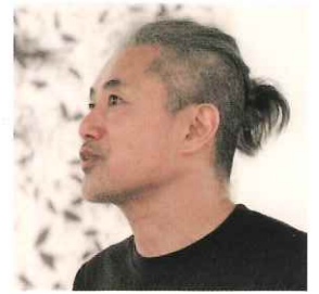
中津川浩章 Hiroaki Nakatsugawa アーティスト／アートディレクター

1954年4月1日、山梨県に生まれる。1976年日本大学芸術学部文芸学科を卒業。コピーライターを経て、1982年エッセイ集『ルンルンを買っておうちに帰ろう』を出版。1984年処女小説『星影のステラ』が直木賞候補に選出されたことを機に、執筆業に専念。1985年『最終便に間に合えば』『京都まで』により第94回直木賞を受賞。1995年『白蓮れんれん』により第8回柴田錬三郎賞を受賞。1998年『みんなの秘密』により第32回吉川英治文学賞を受賞。2000年直木賞選考委員に就任。他、数々の文学賞の選考委員を務める。2011年レジオン・ドヌール勲章シュヴァリエ受賞。2013年『アスクレピオスの愛人』により第20回島清恋愛文学賞を受賞。2018年紫綬褒章受章。『2020(令和2)年、第68回菊池寛賞受賞、また『同一雑誌におけるエッセイの最多掲載回数』においてギネス世界記録認定を受ける。』