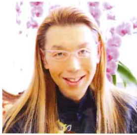
假屋崎省吾 Shogo Kariyazaki 華道家