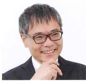
いとうせいこう Seiko Ito 作家／クリエイター