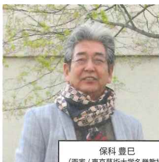
保科 豊巳 (画家 / 東京藝術大学名誉教授)