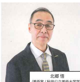
北郷 悟 (美術家 / 秋田公立美術大学学長)