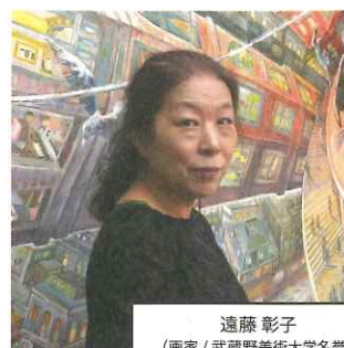
遠藤 彰子 (画家 / 武蔵野美術大学名誉教授)