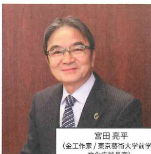
宮田 亮平 (金工作家 / 東京藝術大学前学長 / 文化庁前長官)