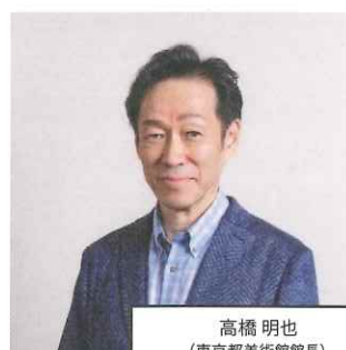
高橋 明也 (東京都美術館館長)