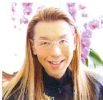
假屋崎省吾 Shogo Kariyazaki 華道家

東京・銀座「假屋崎省吾 花教室」主宰。美輪明宏氏より「美をつもぎだす手を持つ人」と評され、日本初の「華道家」として世界各地で「いけばな」を広める活動にも精励する。クリントン大統領来日時、明仁天皇御在位10年記念式典、明仁天皇御即位・徳仁天皇御即位スタジオ装花、花博覧会のプロデュースなどを手がけ、女子美術大学・客員教授、フランス観光親善大使、オランダチューリップ大使などを務め、「シンピジウムのコサージュ展示（7586個）」の世界ギネス記録にも認定される。着物、ガラス器、ジュエリー、骨董などのデザイン・プロデュースをおこない、デザイナーとしての才能を発揮。また、ライフワークでもある花と建築物のコラボ個展「歴史的建築物に挑む」シリーズを、海外はもちろん、世界遺産、国宝などでも開催。その他、アートパラ深川芸術祭の審査委員、少子化問題、伝統工芸品の振興促進、「花育」などの社会活動も取り組み、華道歴40周年を超え、ますます卓越した存在感を放ち続けている。「假屋崎省吾 花教室」生徒募集中！ お問い合わせ：03-6712-6873 http://www.kariyazaki.jp/