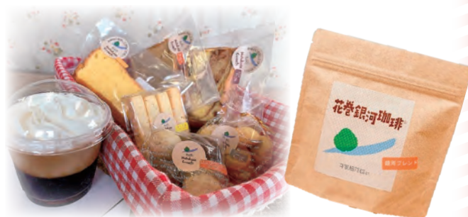
自家焙煎コーヒーの香ばしい 風味と相性抜群♪