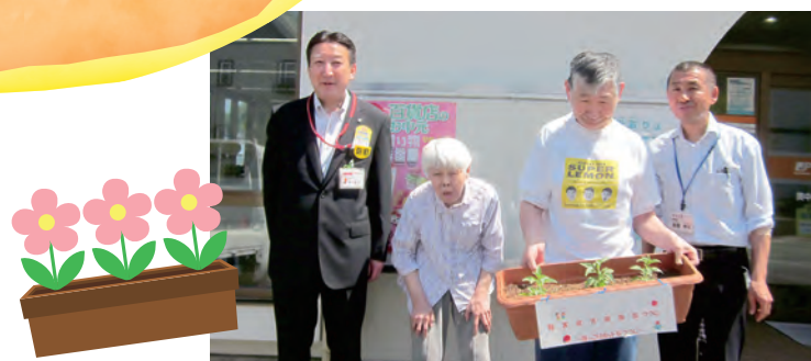
いつもお世話になっている郵便局さんへ