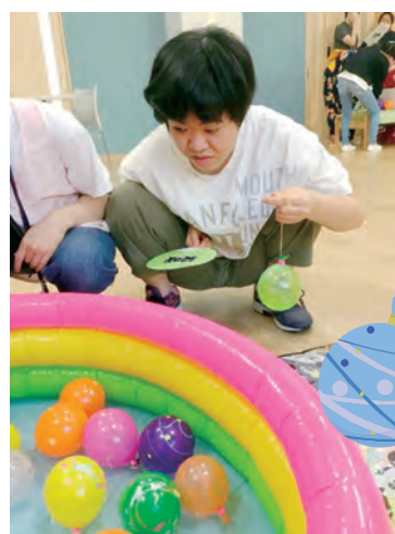
どれにしようかな

後は、感染症の拡大に伴い行事の内容が縮小傾向にありましたが、今年は納涼会の他にも色々なお楽しみイベントが予定されています。今後も子どもたちが楽しんで生活できるよう、工夫して支援を行っていきたいと思います。