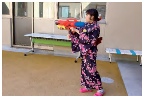
水鉄砲で射的ゲーム!

8月の中旬、ばでは、もりの丘よつに納涼会を実施しました。納涼会は夏休み行事の一つとして行われ、子どもたちが楽しめるような企画を実施しています。今年は子どもたちが実際に参加して楽しむことができる縁日を実施しました。ヨーヨー釣りやお菓子釣り、水鉄砲を使った射的ゲームを準備し、彩、笑、きらめきの3つのエリア毎に遊んでもらいました。浴衣を着てお祭り気分を味わったり、お菓子釣りに夢中になったり、音楽に合わせて体を揺らしながら雰囲気を楽しんだり、思い思いに納涼会を楽しむ姿が見られました。施設移転