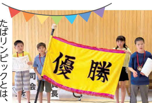
あさひチームが大勝利!!

令和4年度、コロナウィルス感染症の影響もあり未実施となりましたが、今回は令和3年度の競技内容を変更して実施することになりました。中軽度棟・重度棟の利用者それぞれの能力に合わせて、全ての子どもたちが笑顔で楽しみ、勝者になれるような設定で、競技内容について吟味して検討を行いました。また団体競技では、職員チームも参加