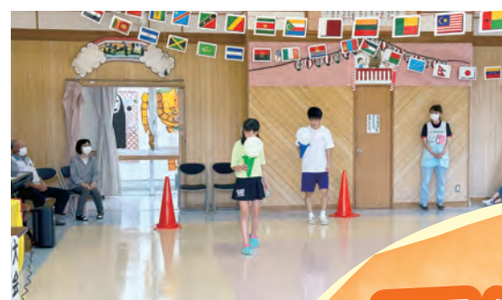
そーつと、そーつと

して「玉入れ」を行い、とても楽しんで行うことができました。事前の準備についても、1回目の際に優勝旗や万国旗といったより本格的な運動会に必要な物品等を作成していたことから、今回必要な競技用の物品の準備のみで、行事係の職員等で協力して行うことができました。今後も、多くの子どもたちと職員が楽しめる室内運動会を実施していければと思います。