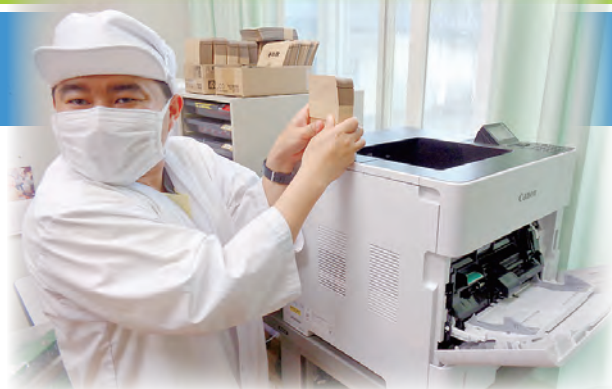
ステキなパッケージを印刷できました!

これまで数々の寄贈をいただいたことに感謝し、これからも利用者の皆様と心のこもった商品を作り続けていきたいと思います。