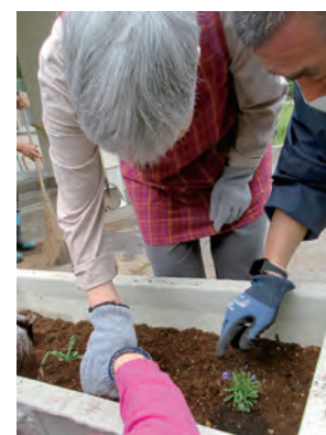
どこに植えようかな

つつじでは、地域貢献活動の一環として、日頃からお世話になっている奥中山郵便局に季節の花苗を植えたプランターを設置させていただきました。花苗は奥中山の三愛学舎さんから購入し、園芸活動の時間で利用者の方と一緒に植える作業を行いました。利用者の方には、それぞれ好きな花苗を選んでもらい、植えた。