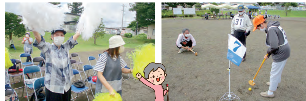
みんなにエールを!!!

新型コロナウイルス感染症が5類へ移行となり、4年ぶりに地域住民をお招きしてグランドゴルフ大会を開催することができました。グランドゴルフ大会本戦の前に、好地荘で利用者様の本戦出場を懸けた予選会