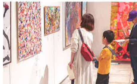
「第5回Art to You!東北障がい者芸術全国公募展」会場風景