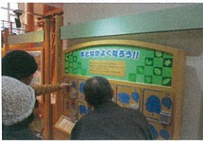
ボタンを押すと鳥の声が聞こえたり、クイズや手作り体験コーナーがあり、とても楽しめました。