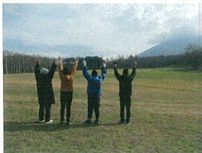
すっかり雪化粧した岩手山の前で！