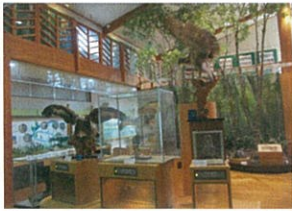
県民の森の雑木林を実物そっくり再現されていました。

11月18日(水)に『ふらっと』利用者さんとスタッフの合計9名で、岩手県民の森にある森林ふれあい学習館『フォレストアイ』を見学してきました。『フォレストアイ』の建物や床材、ホールの椅子や家具までが県産材のカラマツやアカマツを使用しているそうです。木の良さや素晴らしさを体験できる素敵な施設でした。