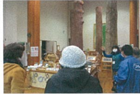
広いエントランスには、見事な大木が何本も立っていました。

11月18日(水)に『ふらっと』利用者さんとスタッフの合計9名で、岩手県民の森にある森林ふれあい学習館『フォレストアイ』を見学してきました。『フォレストアイ』の建物や床材、ホールの椅子や家具までが県産材のカラマツやアカマツを使用しているそうです。木の良さや素晴らしさを体験できる素敵な施設でした。