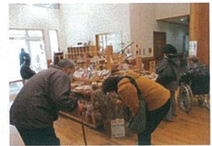
ホールにあるお土産コーナー！どんぐりやキノコのキーホルダー、ドライフラワーなど目を引くものはばかりでした。