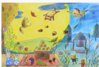
奏 「9月 お月見」 (12か月シリーズより)